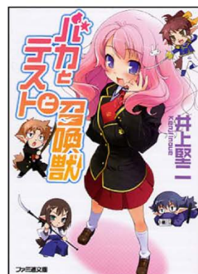
(C)ヤマザキマリ/エンターブレイン (C)森薫/エンターブレイン (C)2010 Sadanatsu Anda・Siromizakana/PUBLISHED BY ENTERBRAIN, INC. (C)2008 Kenji Inoue・Yui Haga/PUBLISHED BY ENTERBRAIN, INC.

エンターブレインは、シリーズ累計 800 万部を突破し、2012 年 4 月に公開された映画も大ヒットした『テルマエ・ロマエ』(著:ヤマザキマリ)や、『乙嫁語り』(著:森薫)など、話題の作品を数多く取り揃える出版社です。